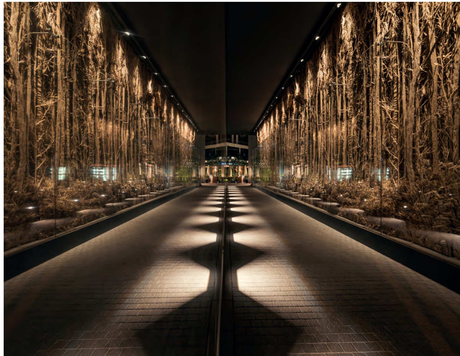
Beaupassage, entrée 14 boulevard Raspail - Eva Jospin, La Traversée , 2018

Plus de 100 œuvres d'art contemporain commandées à des artistes