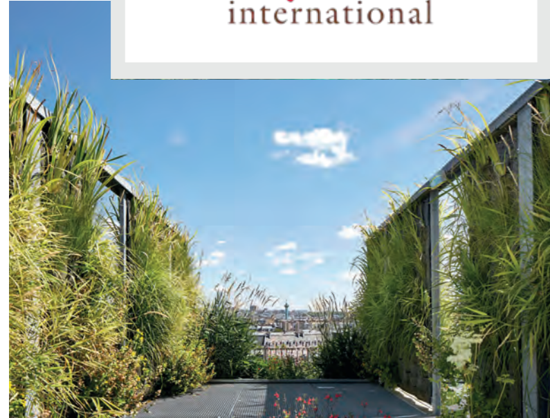
Morland Mixité Capitale, Paris 4 e