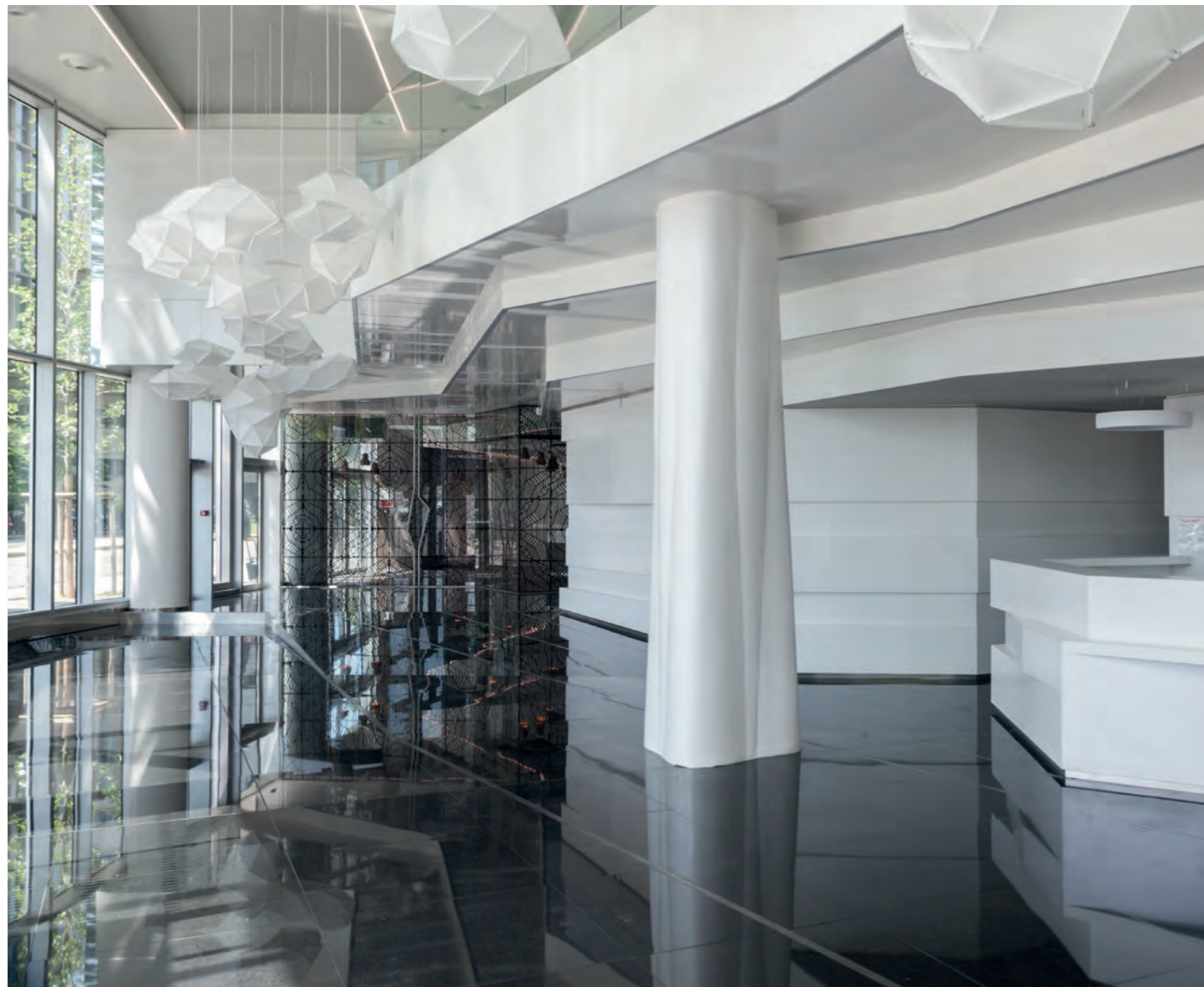
Quai Ouest, Boulogne-Billancourt 92